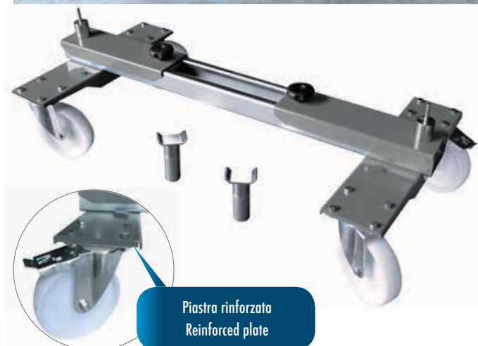
Piastra rinforzata Reinforced plate