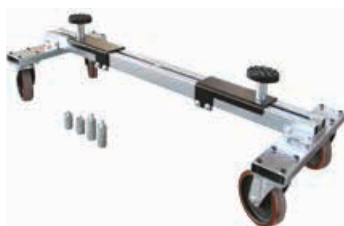
Art. 116 | SUV TROLLEY