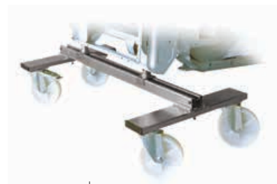
Art. 117 | SVELTO